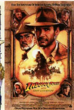
Indiana Jones et la Dernière Croisade (1989)