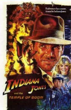
Indiana Jones et le Temple Maudit (1984)