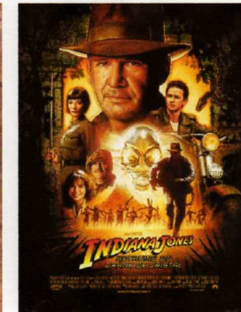
Indiana Jones et le Royaume du Crâne de Cristal (2008)