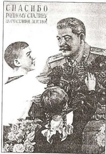
a) Merci à notre cher Staline pour notre enfance heureuse Affiche de 1950